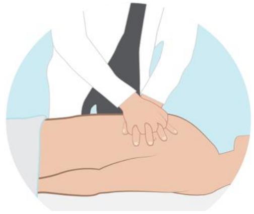
Figuur 1: Hartmassage

Bij een hartstilstand stopt uw hart met kloppen. Er wordt dan geen bloed meer door uw lichaam gepompt. U verliest dan uw bewustzijn en zult overlijden.