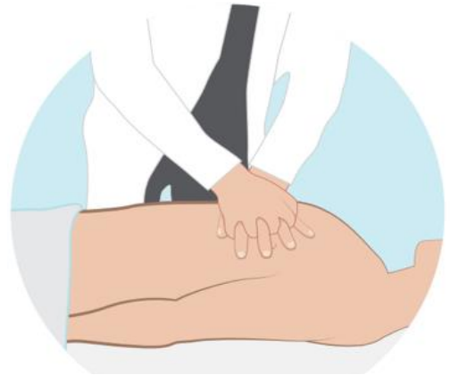
Figuur 1: Hartmassage

Bij een hartstilstand stopt uw hart met kloppen. Er wordt dan geen bloed meer door uw lichaam gepompt. U verliest dan uw bewustzijn en zult overlijden.